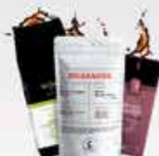
Specialty, Organic, Eco Kávé