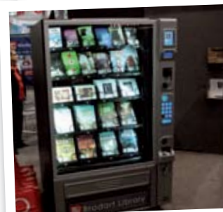
könyvet árúsító automata